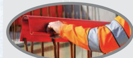
Griffleiste für einfache und schnelle Montage

Ihr firmenspezifischer Aufdruck ist ab 1.000 m kostenlos!